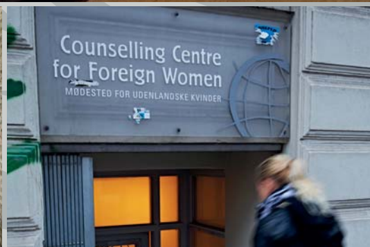
Indsats for udenlandske kvinder