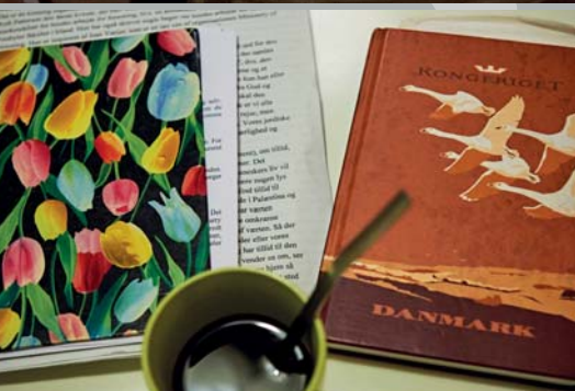
10 år med Svane-grupperne