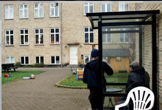
Akutboliger for unge